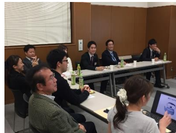
豊田ロータリーアクトクラブ にて講演