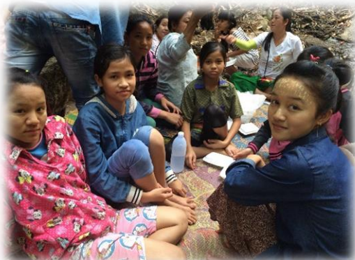
思い思いの場所でご飯です。