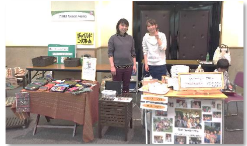
国際ソロプチミスト豊田チャリティーバザーにて