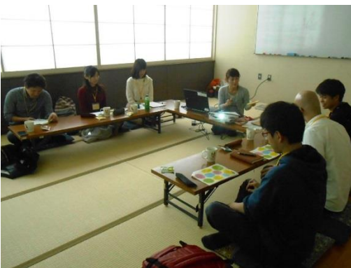
とよた市民活動センターにて講演

国際理解教育事業： 事業報告会やNGO活動に関するイベントへの出展や講演を行い、ミャンマーの現状について多くの人に知ってもらおう活動を行っています。