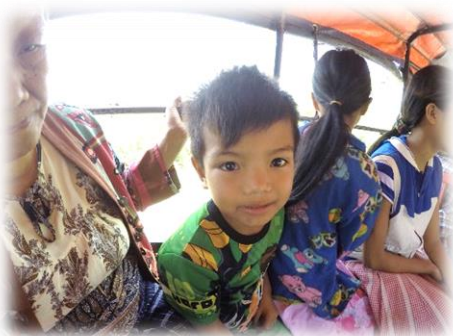
トゥクトゥクに乗って出発です。