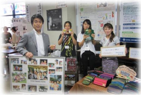
TIAにて豊田市長に活動を応援してもらいました。