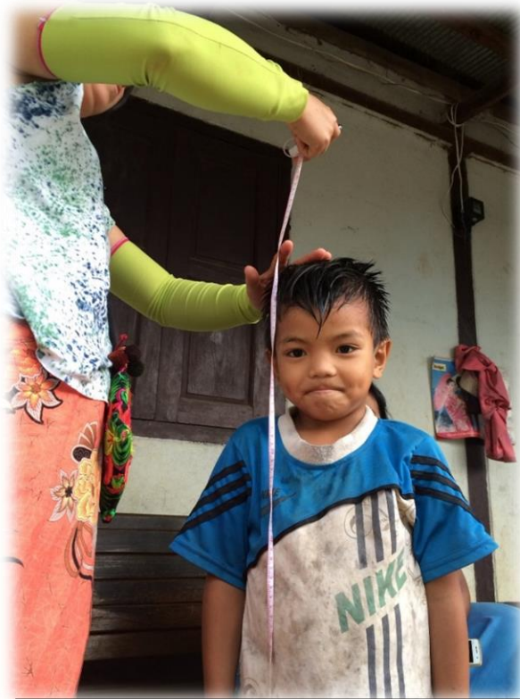
成長報告のため身長を測っています。

定期的に子どもの家庭訪問を行い、子どもの成績、家族の経済状況を調査し、継続的に子どもが学校に通える状況であるか（経済状況が悪化していないか）評価しています。