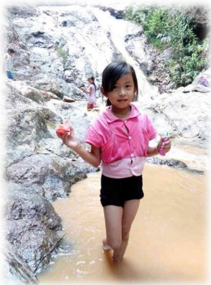
滝に入って水浴び！！